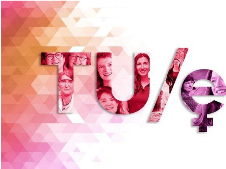
Illustration: Pantelis Katsis